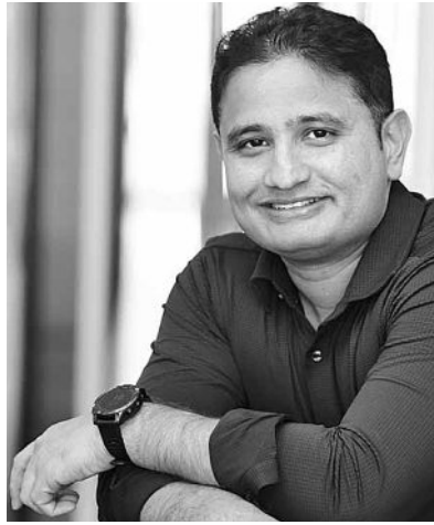
“THIS IS A PLATFORM WHERE WE ATTRACT ENTREPRENEURS WHO RUN 5-10 STORES IN A CITY OR MICRO MARKET”

The platform will retail a comprehensive range of fresh proteins, including seafood, chicken and mutton, across a pan-Indian network, serving customers through standalone stores, shop-in-shop formats, and